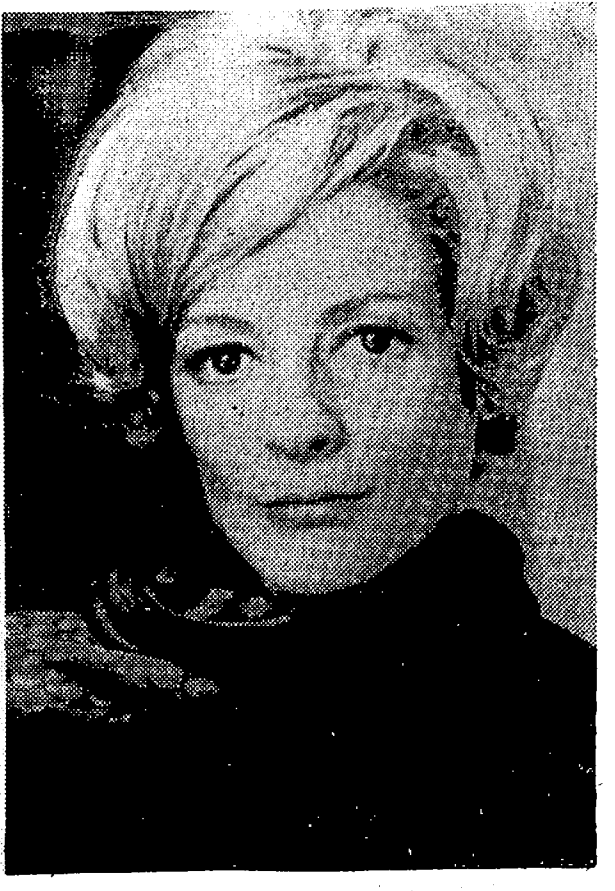
John Wayne, a la izquierda, llora de emoción después de recibir el Oscar al mejor actor del año, en Hollywood. A la derecha, Maggie Smith, proclamada la mejor actriz y premiada con el Oscar de la Academia de Hollywood.