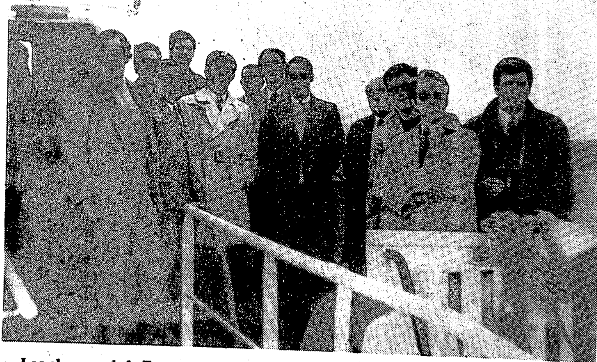
Los alumnos de la Escuela Diplomática de Madrid que han visitado el Campo de Gibraltar, aparecen aquí junto con su director, ingeniero—director del Puerto y presidente de la Junta, durante su recorrido por la Bahía.