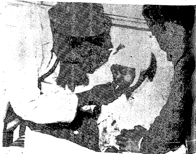
Un bombardeo llevado a cabo por la aviación israelí alcanzó un edificio de una escuela de niños en Egipto, muriendo treinta de ellos y resultando heridos otros tantos. En la foto, uno de los niños heridos recibe cuidados médicos en el hospital donde fue internado.