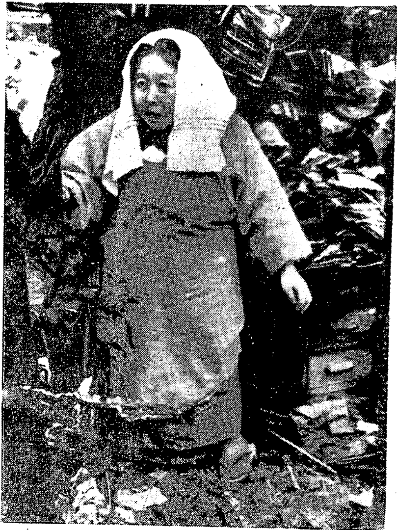
Un tremendo incendio causado por una explosión de gas provocó numerosos muertos y cuantiosos daños en Osaka (Japón). Esta mujer japonesa aparece con la tragedia reflejada en el rostro ante los restos de su vivienda destruida.