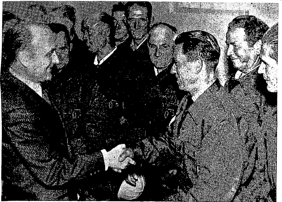
El ministro de Trabajo, don Licinio de la Fuente, ha realizado durante varios días una serie de visitas a las provincias gallegas donde ha entrado en contacto con los problemas de la región. En la foto, el ministro conversa con un obrero después del discurso pronunciado en el edificio para Trabajos Portuarios de Villagarcía de Arosa.