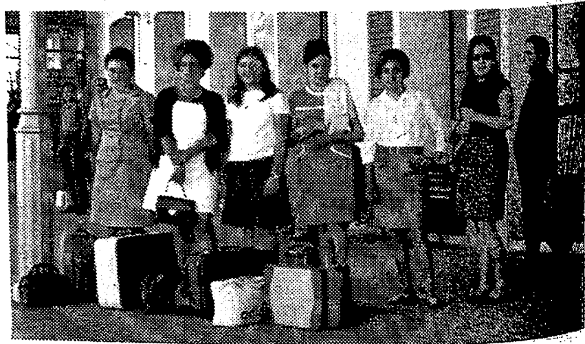
Las agricultoras de la provincia de Castellón que han obtenido los premios establecidos por la Delegación Agrícola se disponen a emprender viaje a las residencias invernales, donde pasarán una temporada.