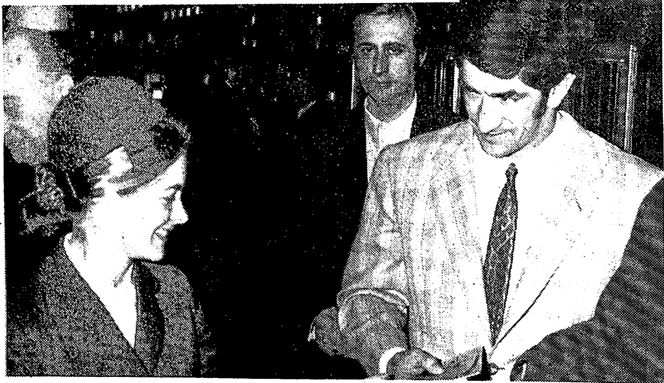
El famoso púgil Urtain, fotografiado en el aeropuerto de Barajas, momentos antes de emprender vuelo hacia Hamburgo, donde esta noche a las diez, en combate que será televisado, se enfrentará al canadiense Leslie Borden.