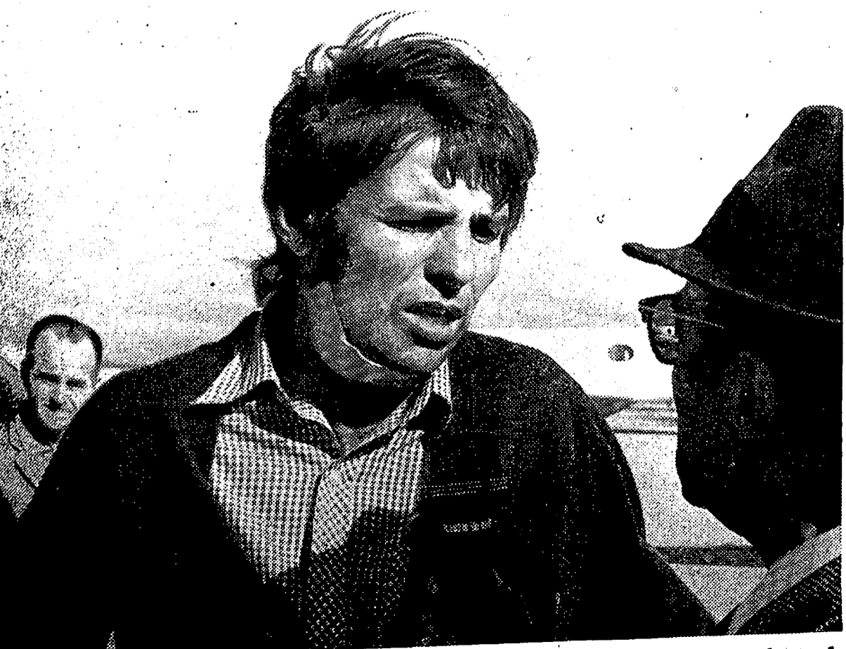
Manuel Benitez "El Cordobés", a su llegada al aeropuerto de Barajas procedente de Bogotá, donde sufrió una grave cogida que pudo costarle la vida porque la cornada pasó muy cerca de la yugular. Su cuello está todavía vendado. Poco después de llegar, "El Cordobés" se trasladó a su tierra donde descansará una temporada.