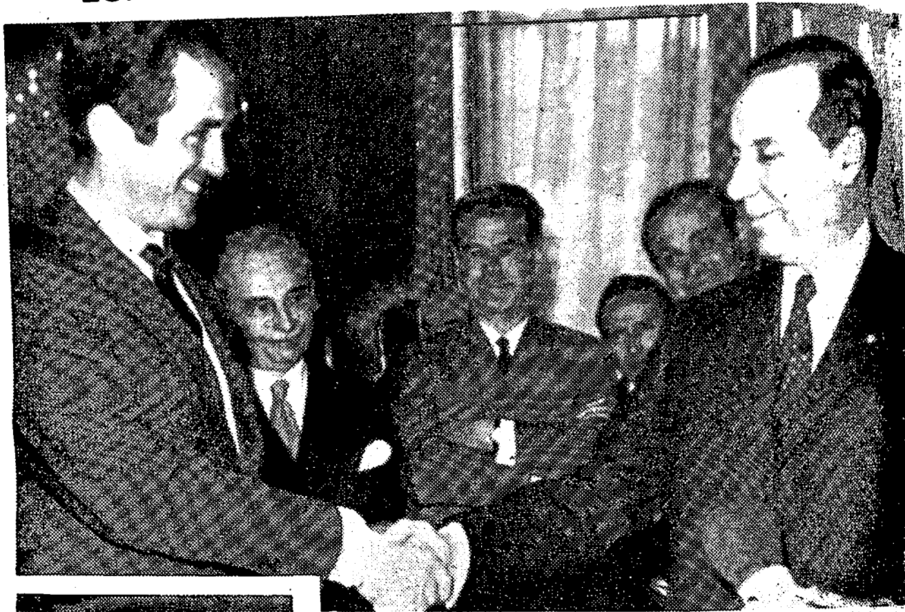
El ministro de Asuntos Exteriores, don Gregorio López Bravo y el ministro de Defensa francés, Michel Debre rubrican con un apretón de manos el acto de la firma de un acuerdo por el que España comprará a Francia 30 aviones del tipo "Mirage".