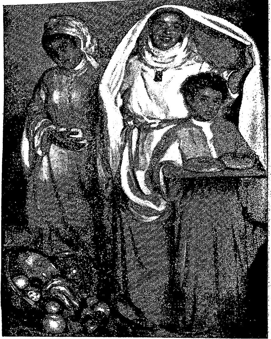
Con este cuadro titulado "Al mercado" obtiene José Cruz Herrera, en 1926, la Segunda Medalla de la Nacional de Bellas Artes.

José Cruz Herrera lleva en sus ojos la luz de la Baja Andalucía, el color de nuestro cielo y el garbo de las mocitas sureñas. Y junto a este hermoso y rico bagaje, una inquietud desbordante y una vocación sedienta de aprender. En la Escuela encuentra unos maestros inmejorables: Cecilio Pla, Joaquín Sorolla, López Mezquita, Muñoz Degraín, Rodríguez - Acosta, Grandes figuras de la pintura española. Cruz Herrera trabaja intensamente, pinta sin descanso, asimila con prontitud las ense-