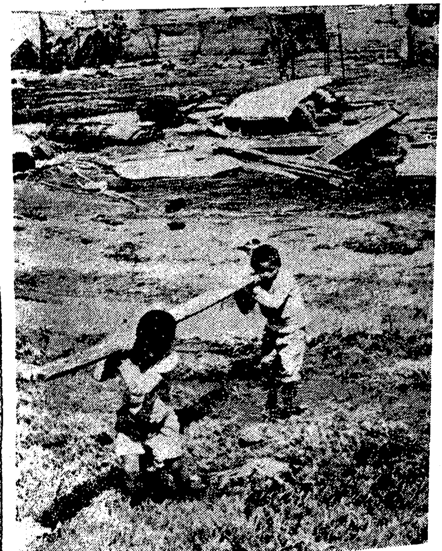
Pasados los primeros momentos, y aunque todavía no ha desaparecido la sensación de terror, empieza a trabajarse en las zonas peruanas afectadas por el terremoto. Hasta los niños trabajan en la reconstrucción de la ciudad de Casma, una de las afectadas por los temblores de tierra.