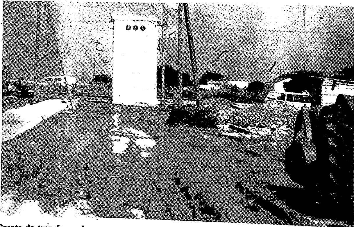
Caseta de transformador y poste del tendido eléctrico que obstaculizan la terminación de la carretera que comunica la barriada de La Atunara con la del Higuerrón, por el Punto Ribot, en La Línea. Desconocemos a quien compete la solución de este problema, pero sí sabemos que debía solucionarse cuanto antes para que continúen los trabajos.—