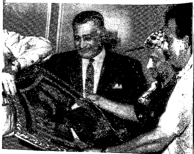
El presidente de la República Árabe Unida, Gamal Abdel Nasser, recibe un escudo simbólico de los combatientes de manos del líder de Al Fatah, Yasser Arafat. A la derecha, Kamal Nasser, miembro de Al Fatah.