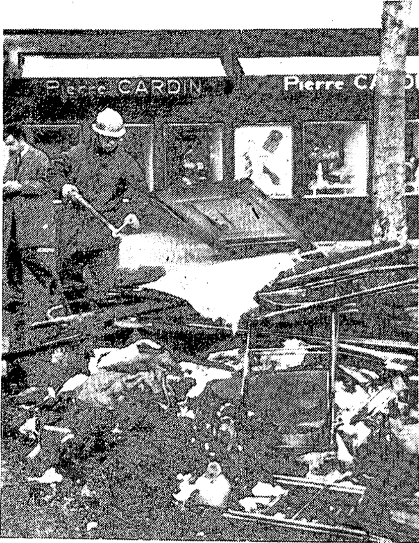
Un violento incendio se declaró en la cuarta de un edificio de París, en el que tiene sus dependencias el famoso diseñador francés Pierre Cardin. Las pérdidas son de consideración. En la fotografía, algunos de los enseres que fueron pasto de las llamas.