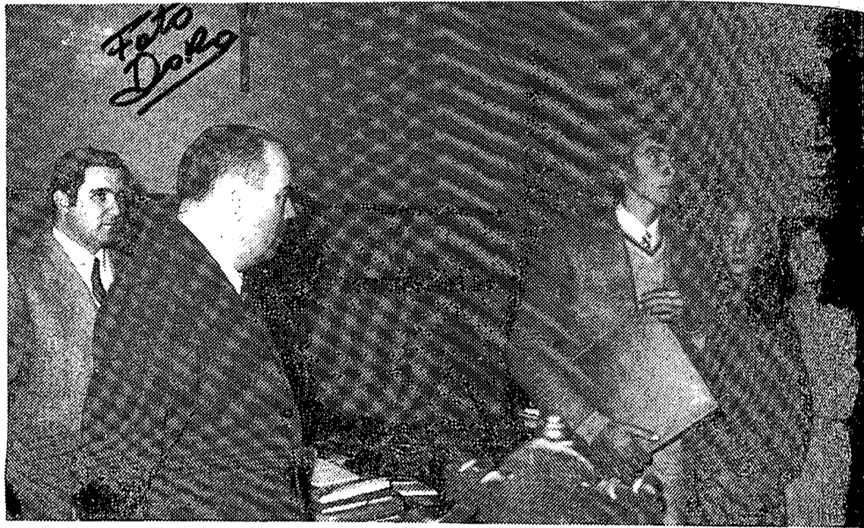
Los planteles masculino y femenino de Extensión Agraria de San Enrique de Guadiaro visitaron al alcalde de San Roque para hacerle el ofrecimiento del título obtenido en el concurso nacional por la mejor labor de equipo. En la foto, don Pedro Hidalgo, les dirige unas palabras de estímulo.—