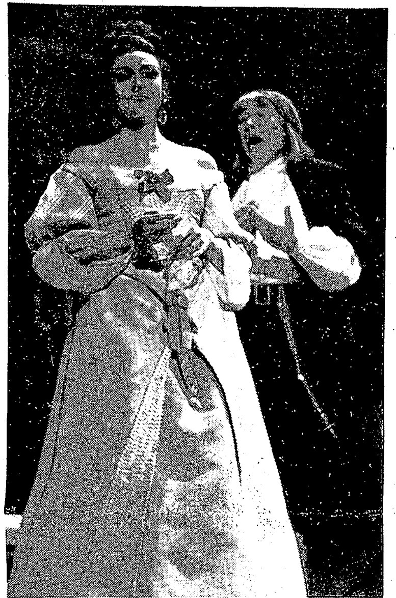
Algeciras tendrá la gran fortuna de poder asistir a las representaciones de la Compañía "Lope de Vega" dentro de la Campaña Nacional de Teatro que patrocina el Ministerio de Información y Turismo. Este es un momento de la representación de "Tartufo", que será puesta en escena en Algeciras.