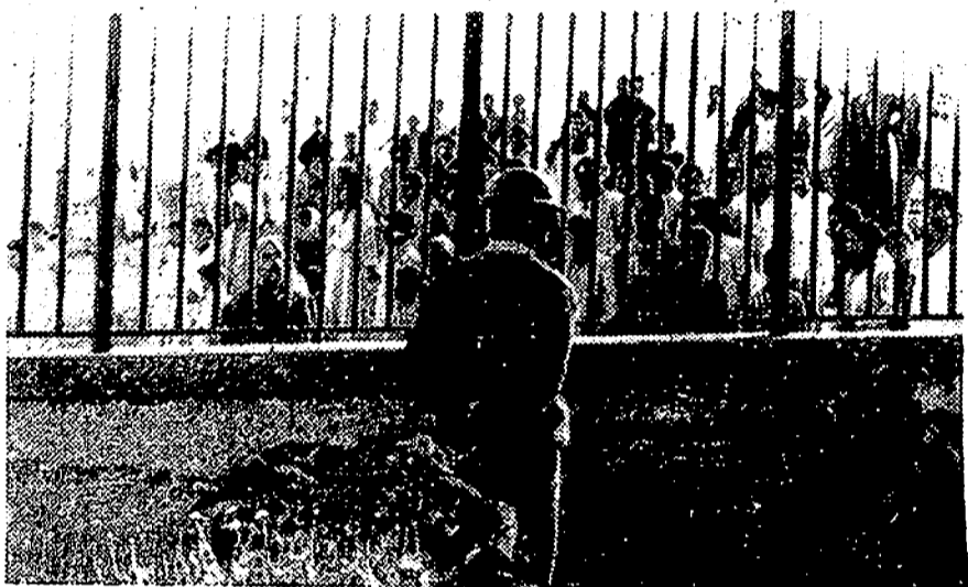
Arriba, una vista del patio de la Khaska Scrap, compañía de metales de El Cairo que fue bombardeada por la aviación israelí y en cuyo ataque setenta civiles resultaron muertos. Abajo, un soldado monta guardia ante la verja de la factoría para evitar el paso a los curiosos, mientras actúan los equipos de rescate.