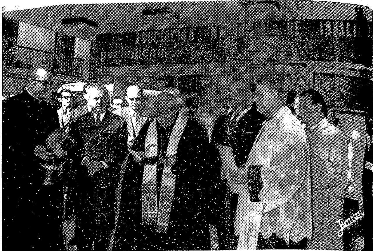
Para festejar el día de Nuestra Señora de Lourdes, la Delegación Provincial de la ANIC, en Cádiz, celebró diversos actos que fueron presididos por el gobernador civil y demás primeras autoridades. En la foto, el obispo de la Diócesis procede a la bendición de un nuevo kiosko y carritos y aparatos ortopédicos, que fueron entregados a asociados necesitados.