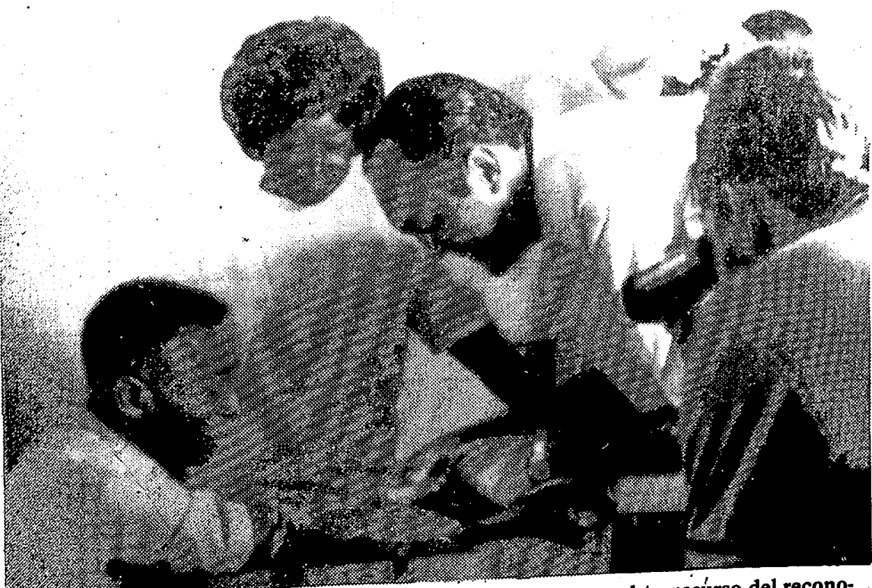
El jugador Pelé durante la prueba de transfusión de sangre en el transcurso del reconocimiento médico, en el Laboratorio de la Confederación Brasileña de Deportes, a que fueron sometidos los componentes de la selección brasileña de fútbol. Eso se llama preparar las cosas con tiempo y calma.