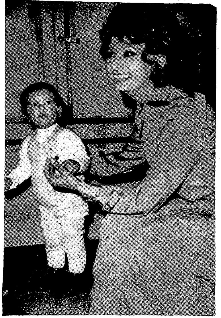
La actriz cinematográfica Sofia Loren, con su hijo Carlo Ponti, durante la recepción a la Prensa en su residencia de Albam Hills, el pasado día doce. Dicha recepción marcaba la terminación de la última película de la bella Sofia "The Sunflowers", en la cual su pequeño Carlo también desempeña su papel.