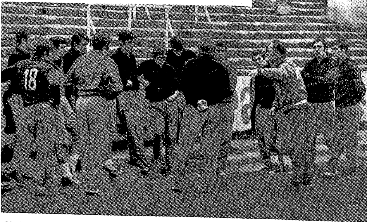
No ha sido precisamente un éxito el ensayo de la selección con vistas a su próximo partido frente a la selección alemana. Los jugadores convocados por Kubala ofrecieron, una vez más, una pobre impresión. En la foto, el técnico se dirige a los jugadores antes de comenzar el último entrenamiento.