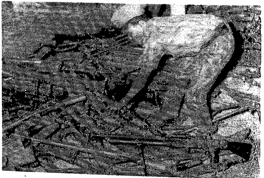
Un soldado nigeriano apila las armas entregadas por los biafreños después de la rendición de las fuerzas y la terminación de la fratricida guerra que ha costado muchas vidas y no menos sufrimientos a los que han podido resistir.