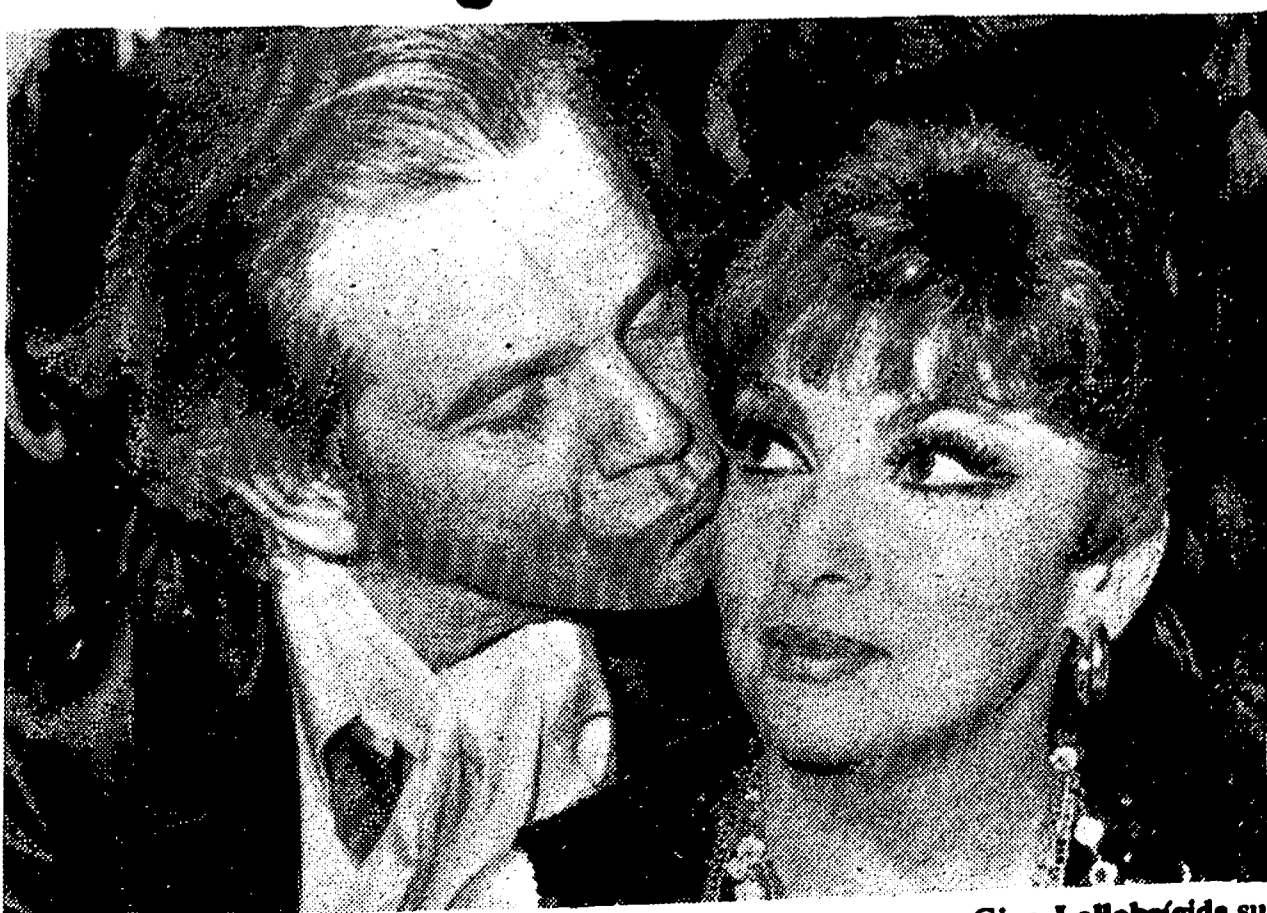
Con este beso, Ken Scott agradece a la siempre joven y guapa Gina Lollobrigida su presencia en la exhibición de moda que él celebró en el Pipe Club, de Roma.