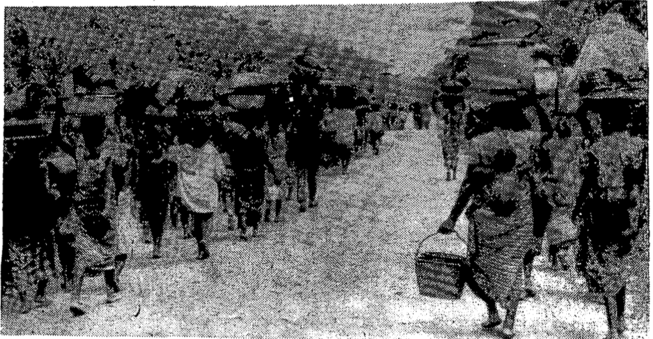
Refugiados de la ex-Biafra, que habían abandonado sus hogares, regresan ahora llevando a la cabeza algunos enseres y ropas, tras la ocupación del territorio por fuerzas nigerianas y la promesa del Gobierno federal de que su seguridad está garantizada.