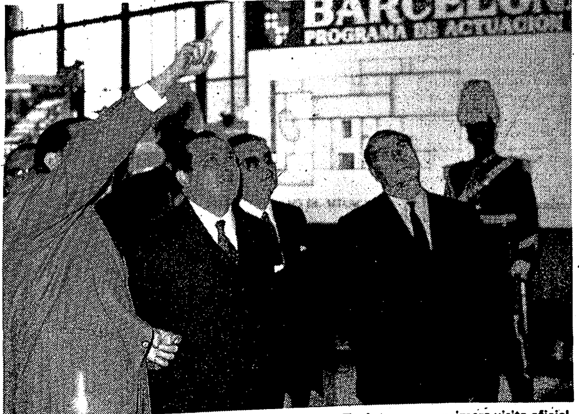
El señor Sánchez Bella, ministro de Información y Turismo, en su primera visita oficial a la Ciudad Condal, recorre la exposición «Barcelona 74» acompañado de las primeras autoridades barcelonesas.