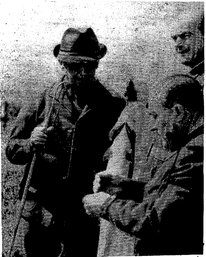
Durante la jornada deportiva que cada día desarrolla en Galicia, donde pasa unos días de descanso, el Caudillo dedica especial atención a la pesca, uno de sus deportes favoritos. Aquí contempla un hermoso ejemplar de salmón que acaba de pescar en el río Ulla.