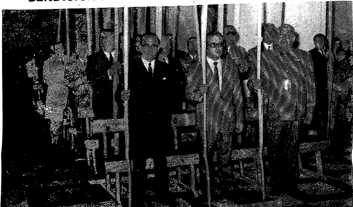
La ceremonia de la bendición de las palmas en el domingo de Ramos revistió en Los Barrios especial brillantez y solemnidad. Asistió la Corporación Municipal, otras autoridades y numerosos fieles.