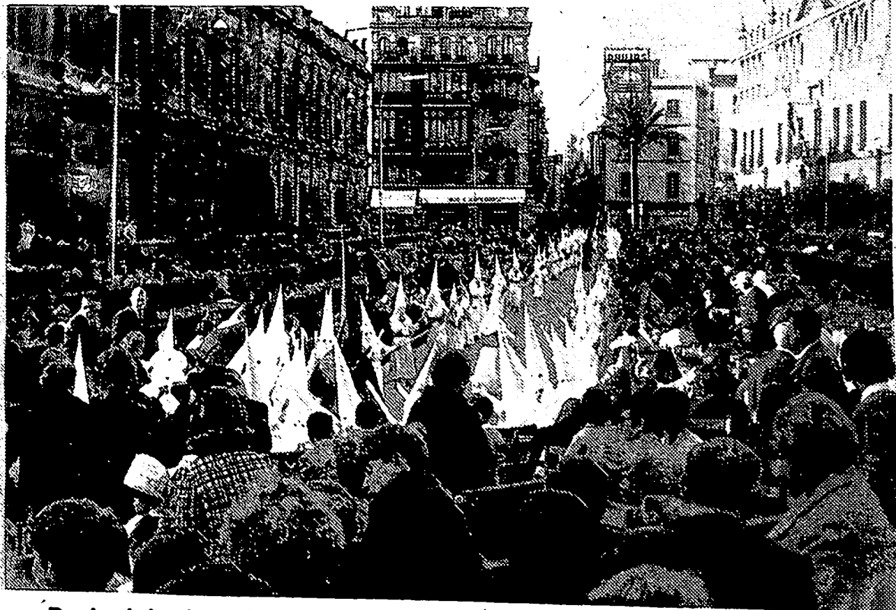
Desde el domingo, Sevilla vive las memorables jornadas de su Semana Santa, que cada año se renueva en su brillantez y solemnidad. Este es el aspecto que presentaba la Plaza del Ayuntamiento durante la procesión del domingo de Ramos.