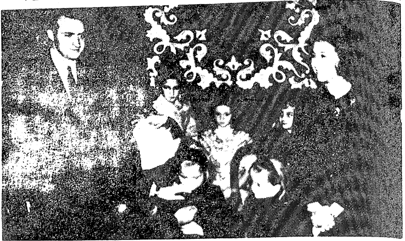
Los Príncipes de España, acompañados de sus hijas las infantas Elena y Cristina han visitado en Valencia la Feria del Juguete y Artículos para la Infancia. En la foto, la Infanta Elena, reina infantil del Certamen, recibe la insignia de oro de la Feria.