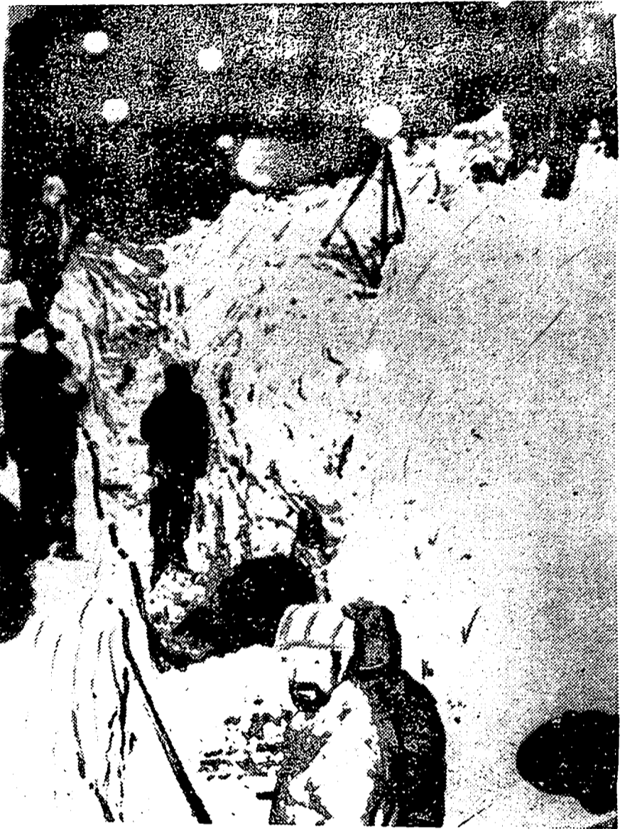
Una avalancha de nieve dejó enterrado un hotel en Lanslevillard (Francia), donde se alojaban numerosas personas dedicadas a prácticas de esquí. Hasta ahora se llevan recuperados siete cadáveres, pero se teme que haya más bajo los escombros.