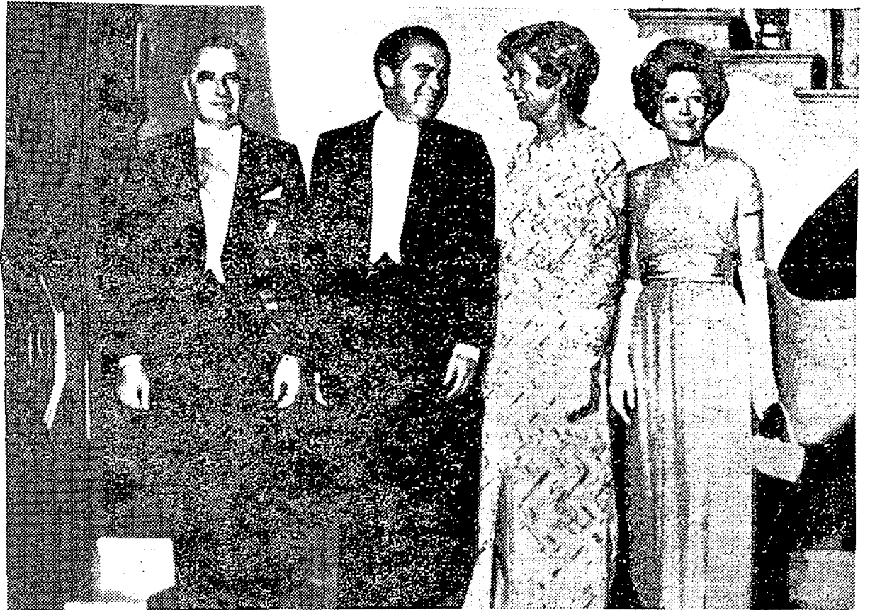
El presidente norteamericano y la señora Nixon posan con el presidente francés y la señora Pompidou, antes de la cena en la Casa Blanca en honor del dignatario galo. Más de cien personas fueron invitadas, incluido el Gabinete y altos oficiales diplomáticos, prohombres industriales y celebridades.