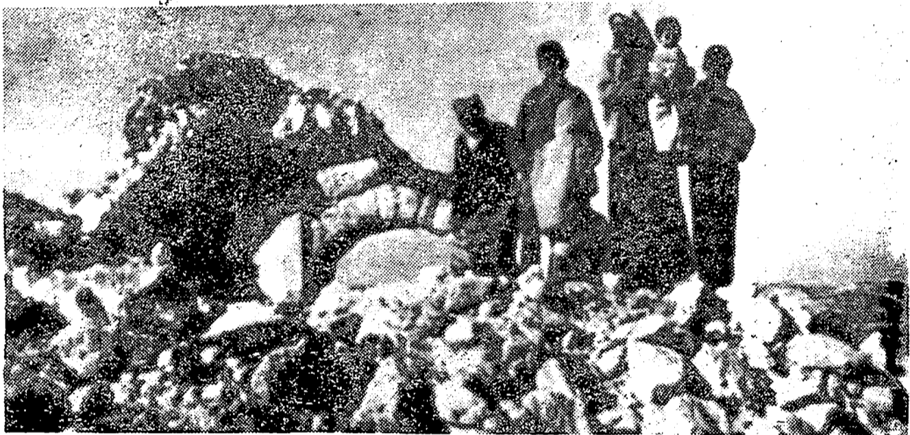
Miembros de una familia árabe contemplan las ruinas de lo que fue su hogar, después de que las tropas israelíes volaran su vivienda en la zona de Hebron. Esta demolición no tiene relación alguna con el ataque terrorista en las cercanías de la misma ciudad a un autocar con turistas.