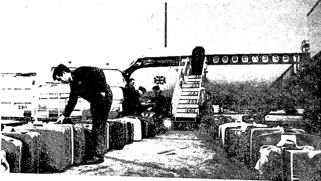
Funcionarios del aeropuerto londinense examinan cuidadosamente el equipaje desembarcado en Londres de un avión de pasajeros con destino a Tel Aviv, vía Roma y Atenas. Dos maletas infundieron sospechas y la salida del avión fue demorada durante 80 minutos.