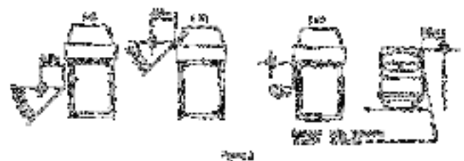
Posición para el ensayo con un sonómetro y un micrófono